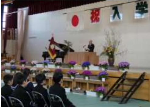
上級生からのエール