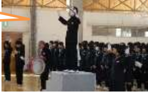
新入生代表の挨拶