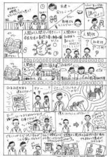
校風委員が学校のきまりについて考えてみた。私たちが考えるきまりの意味とは。