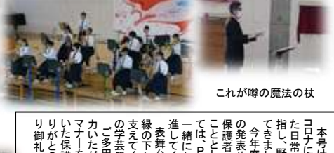
これが噂の魔法の杖