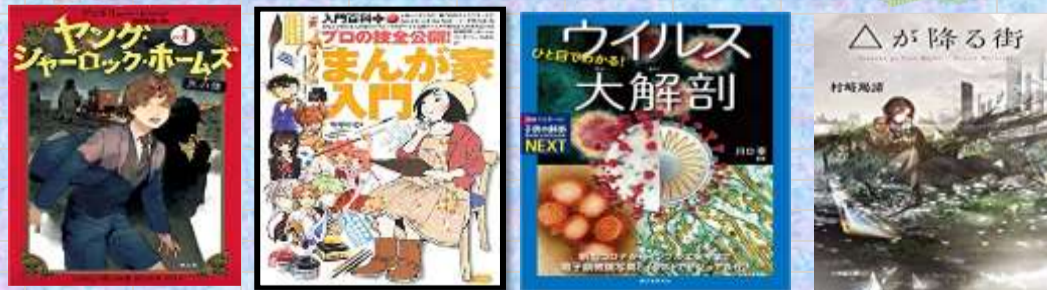
ヤングシャーロックホームズ | 入門百科+プロの技全公開! まんがが家入門 | ひと目でわかる! ウイルス大解剖 | △が降る街

読書旬間が終わりました。たくさんの利用者で賑わいました。旬間は終わりましたが引き続き図書館を利用してもらえると嬉しいです。