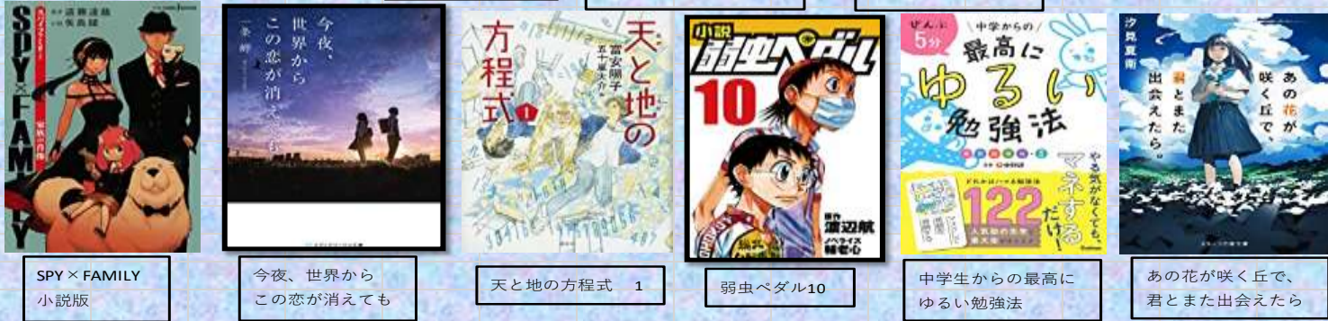
SPY x FAMILY 小説版 | 今夜、世界からこの恋が消えても | 天と地の方程式 1 | 弱虫ペダル10 | 中学生からの最高にゆるい勉強法 | あの花が咲く丘で、君とまた出会えたら