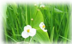
野沢中学校のシンボル「おもだか」