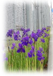
「アヤマメ」の開花が見ごろです。野沢中学校50周年植栽事業で、野沢中学校を昭和36年に卒業した1期生の皆さんが植樹してくれたものです。

子どもたちにコロナ前の生活を思い出してほしいのです。友達と考えを出し合って学んでいくこと。休み時間に校庭を走り回っていたこと。語り合っ給食を食べていたこと。喜んだり怒ったり泣いたりして表情豊かに過ごしていたこと。体を動かし、心を動かして、表情や感情を豊かに充実した生活を送っていたことを思い出してほしいのです。今までできなかったことを思いっきりやって、今までの分を取り戻すくらい「密」になってほしいと願っています。二度と戻ってこない今日という日、「密」になっていない中学校生活。子どもたちにとってかけがえないものから、子どもたちが「密」になれるように支えていきたいと考えています。