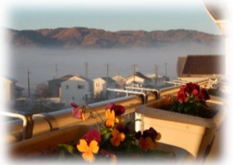
3年5組のベランダから