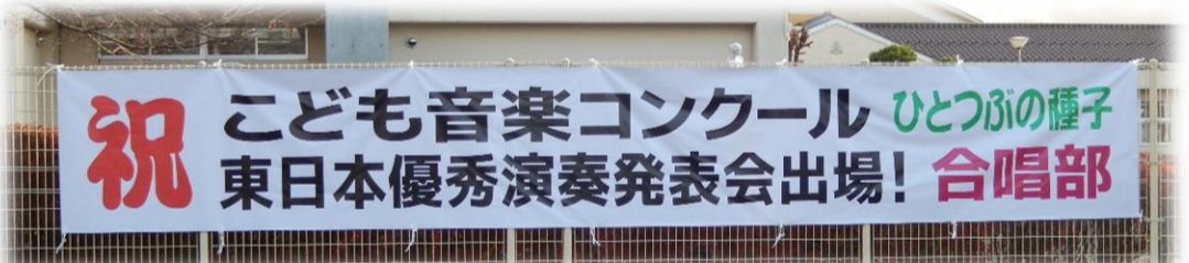
今年も出場です！素晴らしい歌声を響かせてくださいね。

LGBTQ+とは、レズビアン、ゲイ、バイセクシャル、トランスジェンダー、クエスチョンの頭文字で、「性的少数者」を表す言葉です。 LGBTQ+は、人口の8.9%(11.2人にひとり)の割合であり、決して特別な存在ではありません。(左利きの人:8~15%、AB型血液の人:10%)また、嗜好や性癖ではなく、産まれながらのものだということをしっかり理解し、個人や集団間に存在する様々な違い、すなわち「多様性」や「個性」だと認識することが大切です。皆が正しくLGBTQ+を理解し、『当事者の気持ちを受け止めてあげること』で、当事者の味方になることができます。 国籍、文化、宗教、肌の色、障害者、男だ、女だ、LGBTだなど、これらは皆『多様性』であり、みんなが大切にされ、共存できることが重要です。