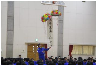
お祝いのくす玉がきれいに！