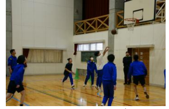
熱戦！ バスケットボール