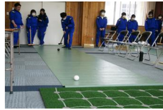
ニュースポーツ 囲碁ボール