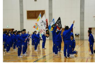
選手宣誓！気合を入れました

3月11日の後期選抜の日に、1, 2年生はクラスマッチを行いました。1年生はバレーボール、2年生はバレーボール、バスケットボールに加え、囲碁ボールやテニピンといったニュースポーツも取り入れて、ひとりひとりが楽しく体を動かしました。