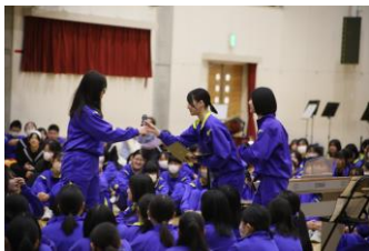
笑いを誘ったインタビュー企画