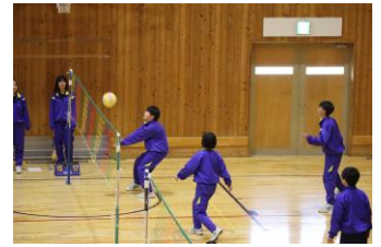
つなげ！ バレーボール