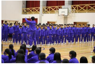
心のこもった各学年の合唱