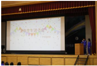
趣向を凝らしたオープニング

3月14日に、2年生が中心となった新しい生徒会が中心となって、3年生を送る会が行われました。各学年から心のこもった発表があったり、3年間の思い出写真がスライドで流れたりして、暖かさを感じつつ楽しい会となりました。