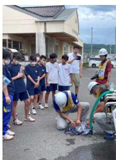
給水車に来ていただき 飲み水を確保しました