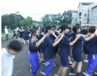
フォークダンスの様子