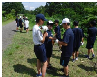
MYスプーンのマテリアルを探しに

1学年の宿泊学習は、今年から行き先を新潟県妙高市に変更して行いました。天候の悪化が心配しつつ出発しましたが、大きな崩れはなくほぼ予定通りの日程を行うことができました。事前の準備や当日の活動を通して、学年の一体感を育むことができました。