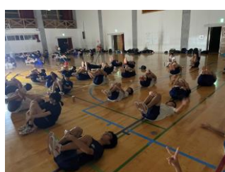
体調維持のためのストレッチ