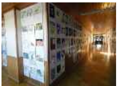
展示見学もありました