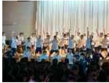
体育の授業で創りあげた総勢180名のダンスパフォーマンス