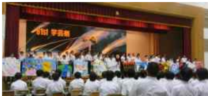
全校制作 各クラスの学級旗