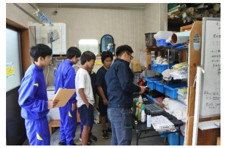
(写真は1年生「ふるさと探究」の様子)