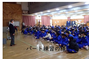
パート練習の様子

デートDV啓発セミナー(3年) 講師の方をお呼びしてデートDVについて学びました。