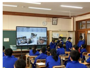
1年生ふるさと学習の発表より

当日は保護者の方や地域の方も多く来校され、これまでの学習の成果に触れていただきました。本校でも探究的な学びはどうあったらよいかについて研究を進める中で十分な探究的な活動ができたかどうかについては課題が残った部分もありますが、こういったアウトプットの経験を通してさらに学びを深めてまいりたいと思います。1年生のふるさと学習、2年生の職場体験学習、3年生の福祉体験学習では地域の皆様にご協力を賜り進めることができました。この場をお借りして感謝申し上げます。