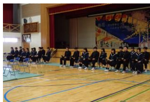
生徒総会 旧役員の皆さん

12月1日(月)に生徒会立会演説会・選挙が行われました。来年度の生徒会の在り方を方向づける大切な選挙にあたり、一人ひとりがきちんと向き合って投票をして新生徒会長、副会長が選出されました。