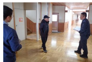
不審者役に対峙する職員

今年度、本校では地震・火災による避難訓練を行ったり河川氾濫等による水害が起こった際の対応を学んだりしてきました。今後も安全に過ごせる学校づくりへの取り組みを進めてまいります。