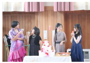
演劇部の発表の様子