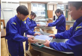
12月23日 生徒会引継ぎ会