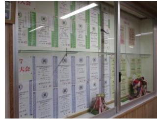
今年度獲得した賞状・カップなど

年末に2年生が3年生から引き継いだ生徒会が活動をスタートしました。1月13日(火)に開かれた第1回生徒会委員会では、それぞれの委員会の新委員長さんや副委員長さんが緊張した面持ちで会を進めていました。3年生を送る会の準備も着々と進んでいます。新しい生徒会の皆さんがどのような会を作り上げるのか、今からとても楽しみです。